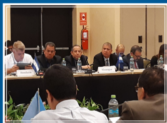
Delegación de Nicaragua en la XL Plenaria del GAFILAT